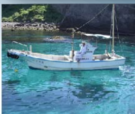
監視船の指示に従いましょう

ブイの外側は海流が速くフィンをつけていても流されるくらい危険な場所、近づかないようにしましょう、万一、流された場合は潮流に逆らわず陸地側方向へ移動しましょう