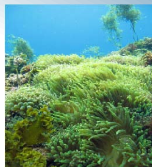
イソギンチャクの群落

昔はヒメエダミドリイシという名前でしたが近年名前が変わりエダミドリイシとなりました。産卵は夏前と言われております。寒さに強く成長が早いです。北限は伊豆半島と言われております。チヨウチヨウウオなどの季節来遊魚の隠れ場所となりますので秋口には非常に多くの生物をサンゴのまわりで見ることが出来ます。通年通してカクレエビとカクレガニの住みかにもなっています。サンゴは傷付きやすいので触らずに観察しましょう